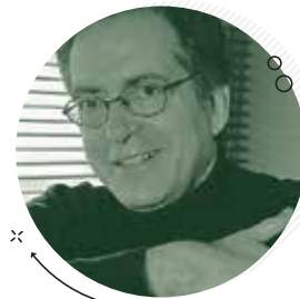
Ευγένιος Τριβιζάς Συγγραφέας