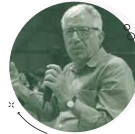
Γεώργιος Σπανός Ομότιμος Καθηγητής Διδακτικής ΕΚΠΑ